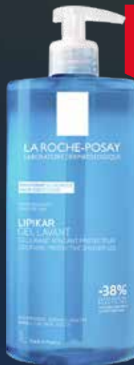
LA ROCHE-POSAY Lipikar gel lavante 1000 ml Sejas, ķermeņa mazgāšanas želeja.