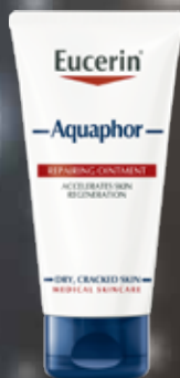
EUCERIN Aquaphor Repairing Ointment 45 ml Atjaunojošā ziede ļoti sausai ādai.