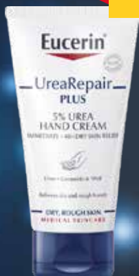
EUCERIN Urea Repair Plus 75 ml Roku krēms.