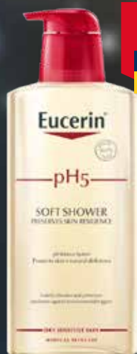
EUCERIN pH5 dušas želeja 400 ml Jutīga, sausai ādai.