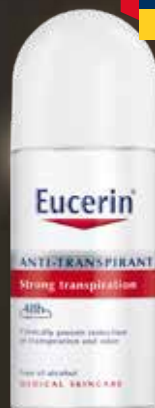
EUCERIN pH5 antiperspirants 50 ml Aizsardzība pret spēcīgu svīšanu, 48 h.