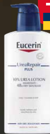
EUCERIN UreaRepair PLUS 400 ml Ķermeņa losjons sausai, raupjai ādai.