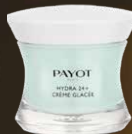
PAYOT HYDRA 24+ CREME GLACEE 50 ml Mitrinošs sejas krēms.